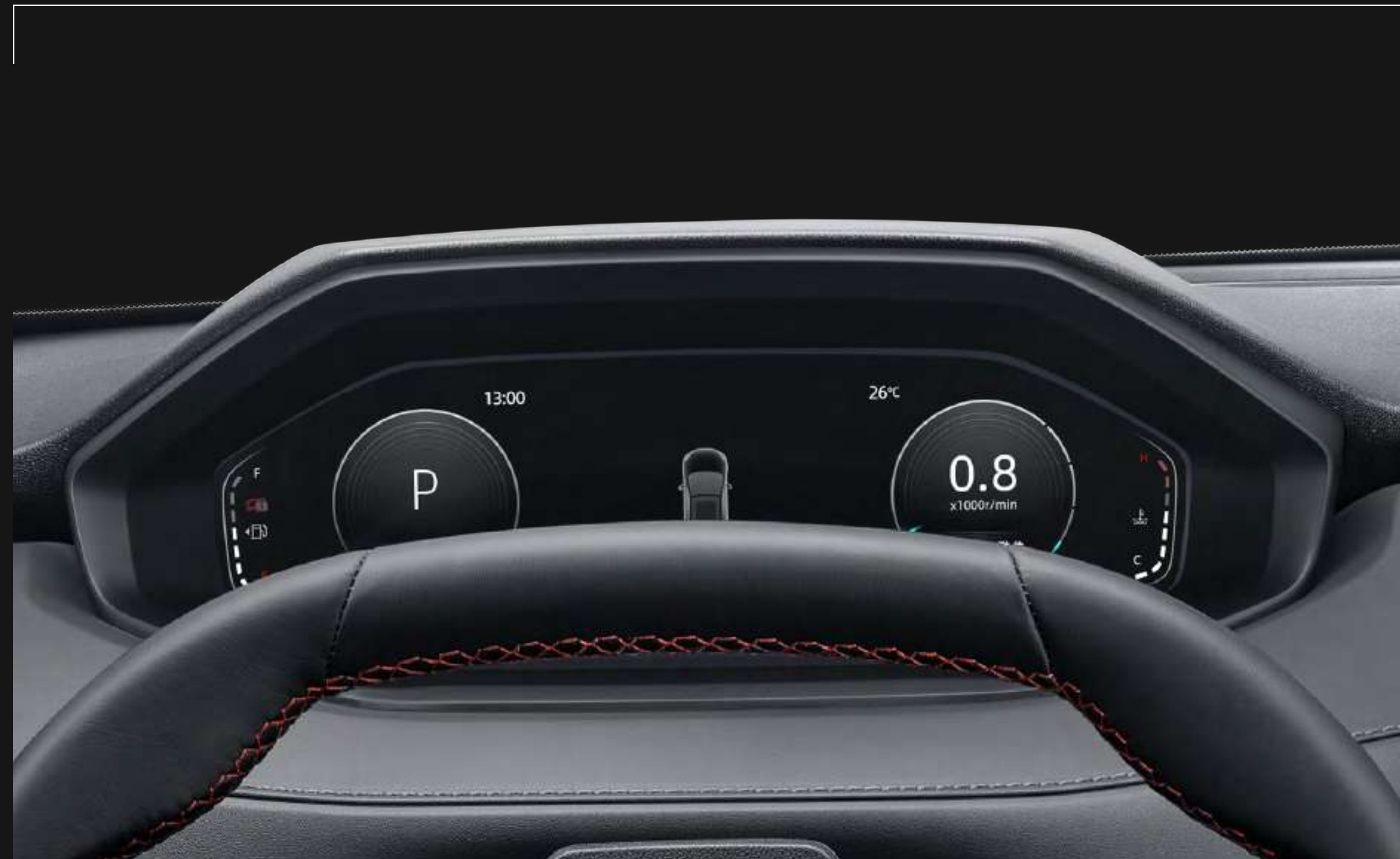
10" LCD CLUSTER SCREEN