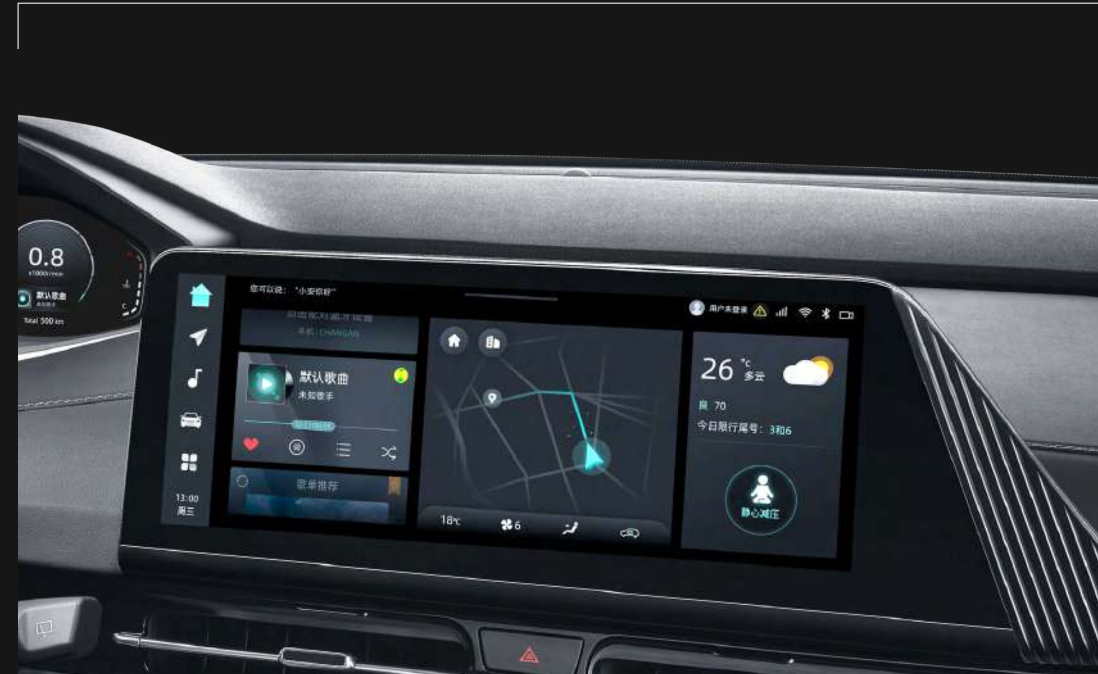
12.3" INFOTAINMENT SCREEN