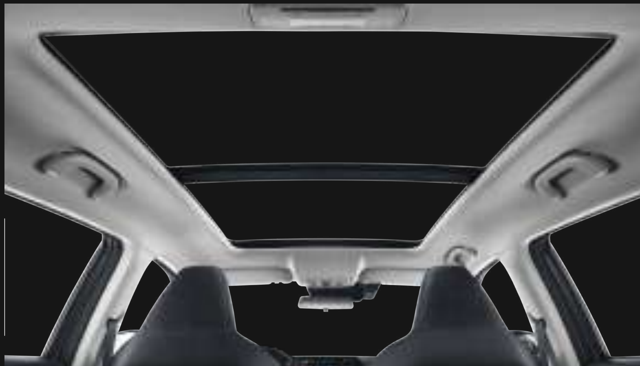
SKY VIEW PANORAMIC SUNFROOF